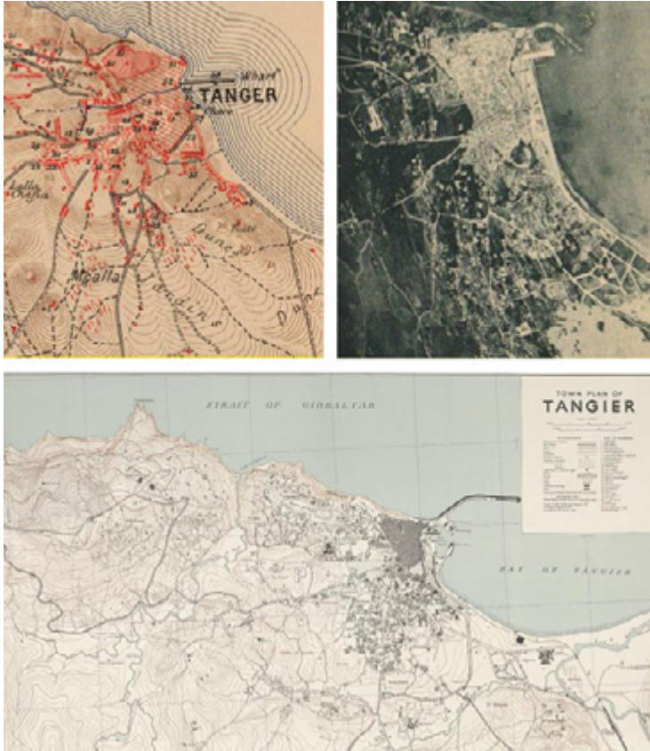
Figura 5. Arriba a la izquierda: mapa «Environs de Tanger, por el Capitán Larras», septiembre de 1905. Arriba a la derecha: foto aérea de Tánger, 1925. Abajo: mapa de Tánger elaborado por el Ejército de EE.UU., 1943. 20