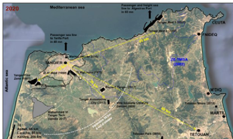
Figura 6. Estado de la infraestructura de recepción empresarial en la región. Tanger-Tétouan-Al Hoceima: Puerto Tánger Med, zonas industriales y francas –a finales de 2020. 31