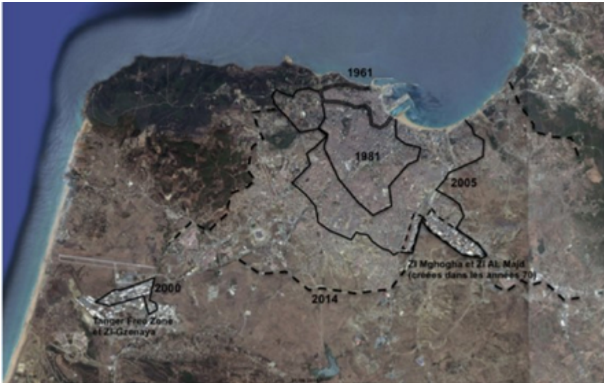
Figura 7. Ampliación de la ciudad de Tánger (1961-2014).