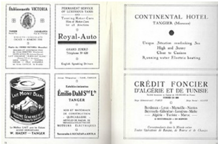
Figura 4. Anuncio de época que indica algunas actividades económicas realizadas en Tánger. 17