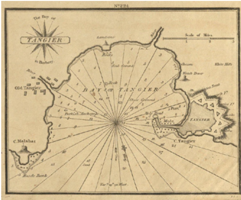
Figura 2. Mapa de la bahía de Tánger, período del siglo XVII al XVIII. 8